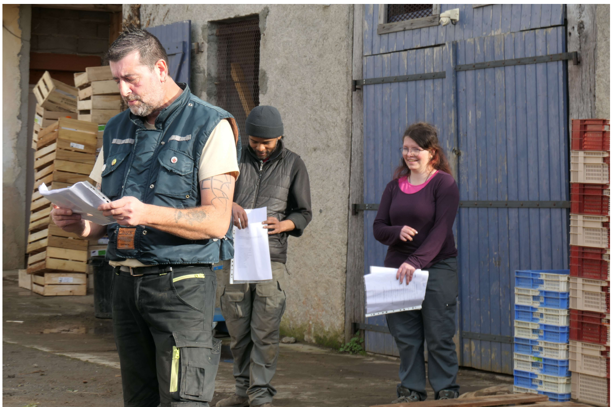
Jardins du Comminges

A chaque fois, l'atelier se clôture sur une lecture théâtralisée ou un podcast car il me semble primordial que cette prise de parole fasse l'objet d'une restitution et que chacun.e des participant.e.s puisse en conserver une trace.